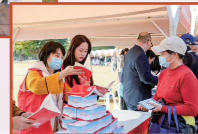
(福州市司法局普法与依法治理处)