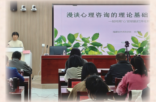
(福州市社区矫正管理局)

参训人员普遍反映，本次培训课程设置科学，内容涵盖广泛，针对性强，不仅更新了知识储备，拓宽了工作视野，更解决了诸多实务操作中的困惑，对今后规范执法程序、创新工作方法、提升工作质效具有重要的指导意义。大家纷纷表示，今后将以更加饱满的热情、更加专业的技能、更加扎实的作风，积极投身于社区矫正事业，为平安福州、法治福州建设贡献更大的力量。