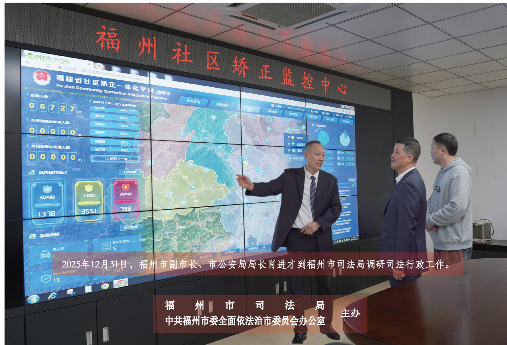
2025年12月31日，福州市副市长、市公安局局长肖进才到福州市司法局调研司法行政工作。