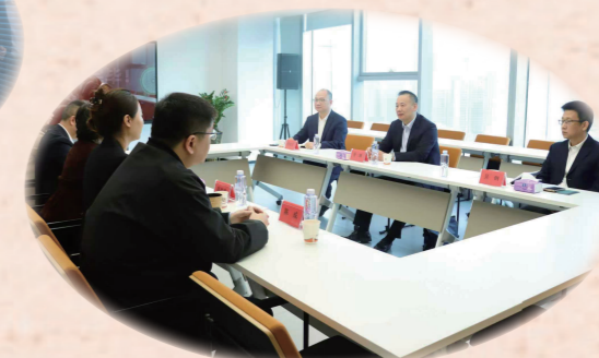
(福州市司法局办公室 福州市律师协会)