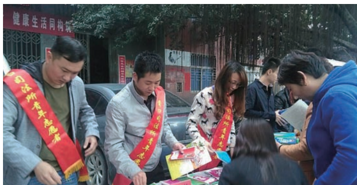
闽侯县青口司法所开展法治宣传活动

原来，这68位农民工是某汽车电器有限公司的员工，被公司原经营人拖欠工程款共计162万元，而现经营者是原投资人的债权人，由于原债权人欠其款项4000多万元，才将公司抵押给他。因此，现经营者认为所拖欠的工程款不该由其偿还，双方就欠款问题无法达成一致意见。这些农民工多次讨薪未果，甚至采取围堵工厂大门、聚众到公司闹事等方式进