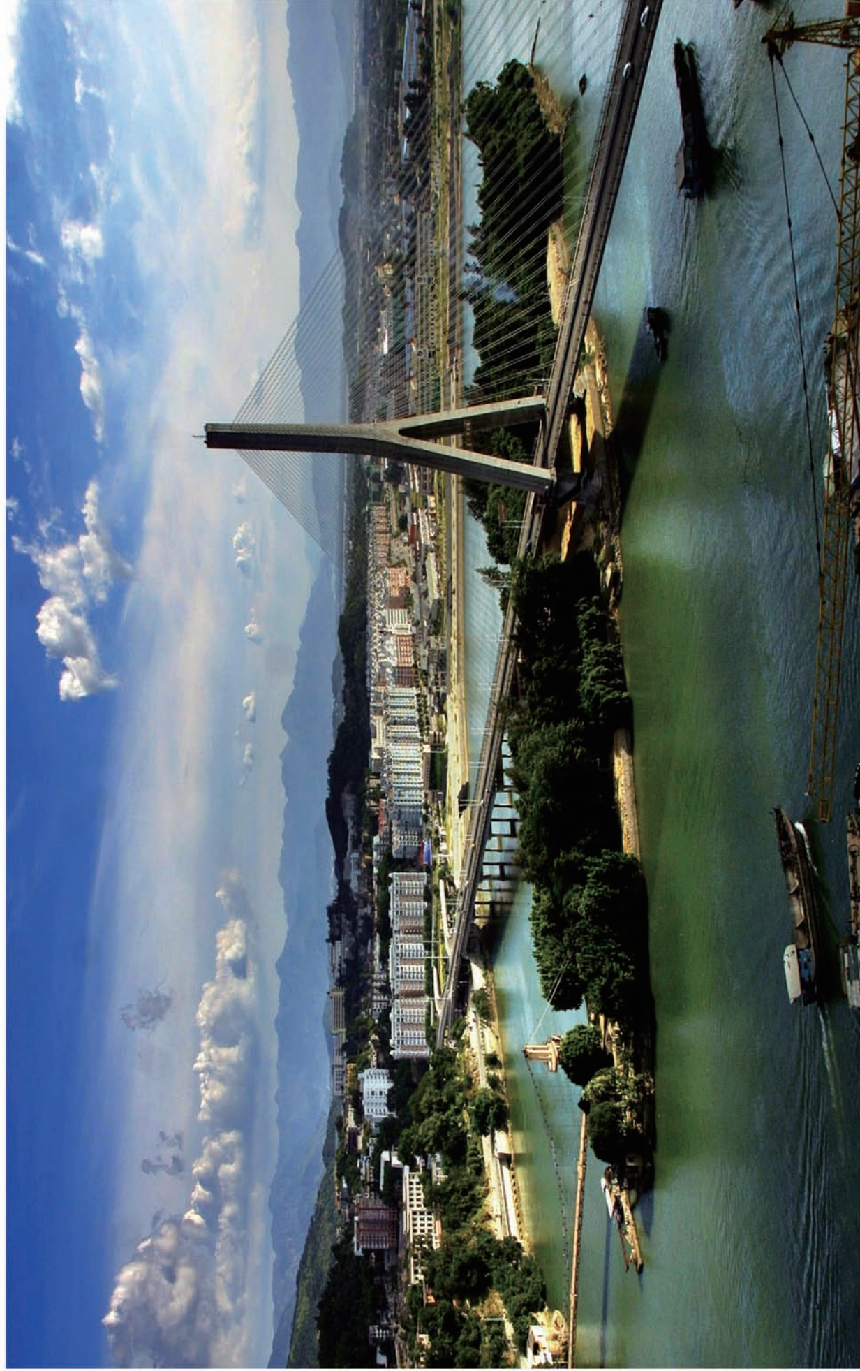
利剑出鞘——三县洲大桥