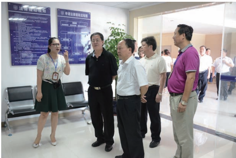
福建省司法厅副厅长俞建春一行莅临连江县公共法律服务中心

福州市司法局局长唐新文对下一阶段全市公共法律服务体系建设进行了工作部署,强调全市司法行政系统各单位、各部门务必要认真对照《福州市人民政府办公厅转发市司法局关于推进全市公共法律服务体系建设实施意见的通知》(榕政办[2014]188号)文件确定的2015年至2020年工作目标、任务要求,凝心聚力、扎实工作,结合本地经济社会发展水平和基层工作实际,因地制宜、突出特色,不断健全公共法律服务网络,整合公共法律服务资源,强化组织领导,加强舆论宣传,