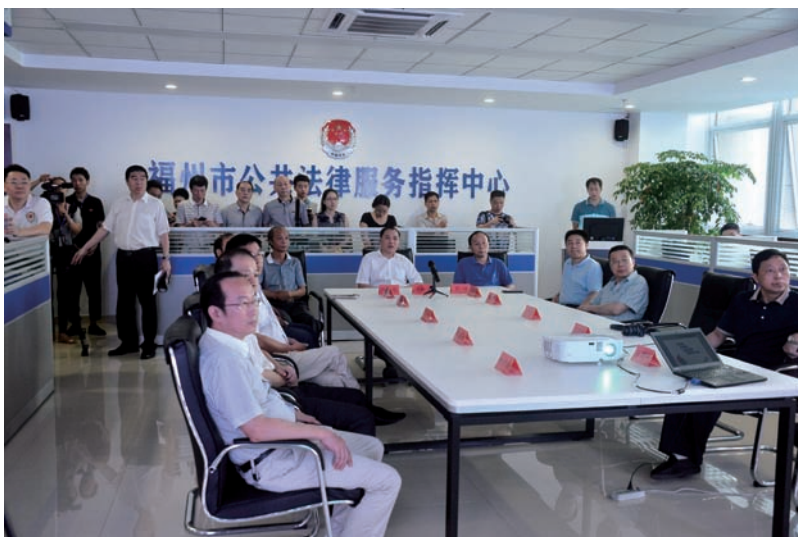
参会人员参观福州市公共法律服务指挥中心

抓紧建成“政府主导、司法行政牵头、部门联动、社会协同”覆盖城乡、优质均等的公共法律服务体系,努力打造人民满意的服务型司法行政机关,为服务全市工作大局、服务广大基层群众作出新的更大贡献。