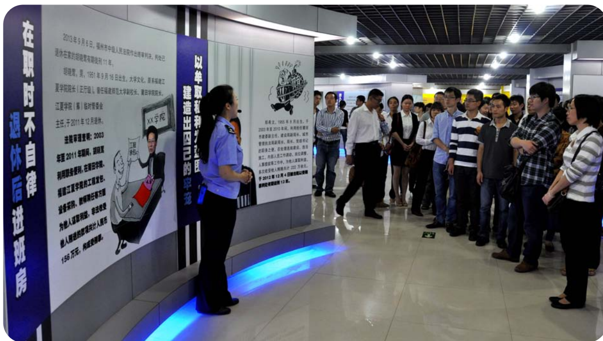
■11月，福州市司法局公管处组织公证员参观廉政教育警示基地。(林文)