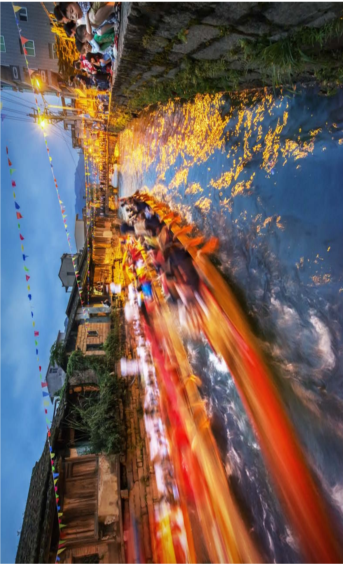
《龙舟竞渡》——长乐三溪