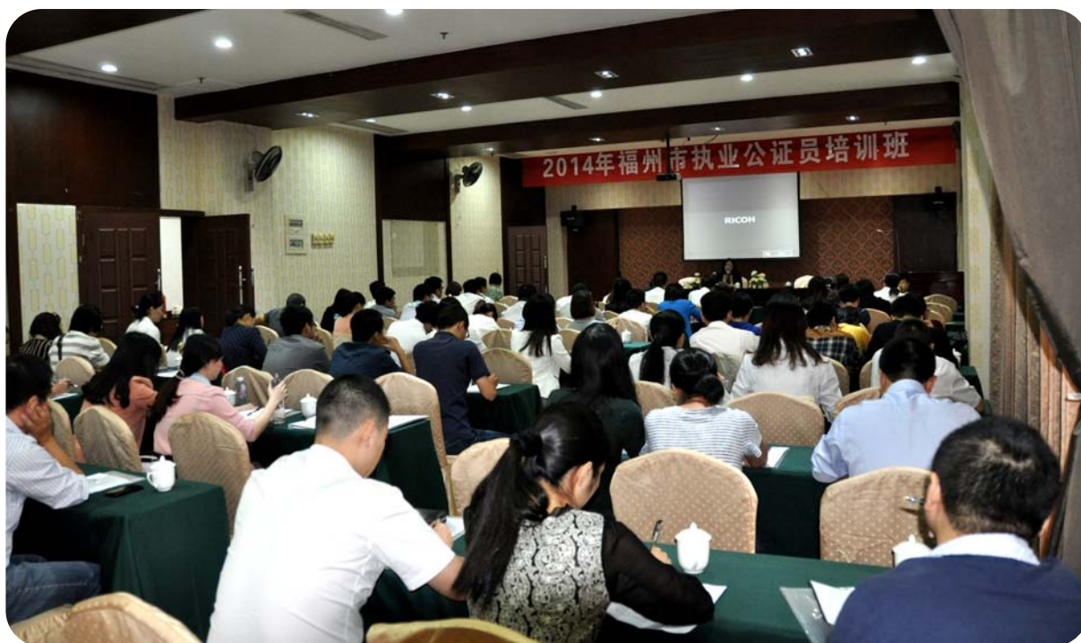
■11月，福州市司法局公管处举办2014年公证员培训班。(林文)