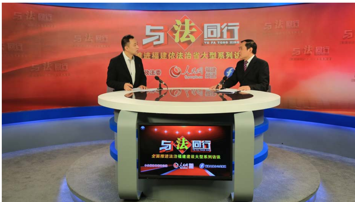
■图为唐新文局长参加由中共福建省委政法委、人民网福建频道、福建省广播影视集团电视公共频道联合主办的“与法同行、推进福建依法治省大型系列访谈”节目。